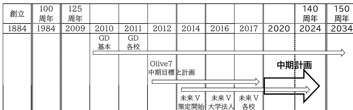
グランドデザイン(GD)・Olive7(中期目標と計画)・未来ビジョン(未来V)・中期計画の変遷

これまでのOlive7(中期目標と計画)は、次の5年間の「中期計画(2020-2024)」に含める形で再構築し、今後取り組むべき重点課題を設定するとともに、それらに対する行動計画を構築し、確実に実行していくこととしました。