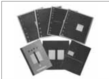
水船先生デザインの教科別ノート

教職員全員が視点を子供の座に置いて把え、日常の様々な問題を子供の立場から研究していこうとするものでした。各クラスの問題も全教職員の問題として受けとめ、学院の特別な小学校教育を確立する場を備えたのです。その後、小学校の教育活動は全てこの場を通して練り上げられたと言えるのです。「サービス・グループ」(日直・係り)、「緑の勉強室」・「グリーン・チャンネル」(夏休みワーク帳)、「子供ライブラリー」(図書館)、「一斉テスト」(学力テスト)、「ぶどうの木子ども会」(クラブ)、「秋の屋外なかよし会」(運動会)、「緑の学校」(後の校外宿泊学校)、「夏・冬のはげみ会」(夏・冬期休暇の補習授業)等々、いずれも今日まで受け継がれている独自の教育活動です。