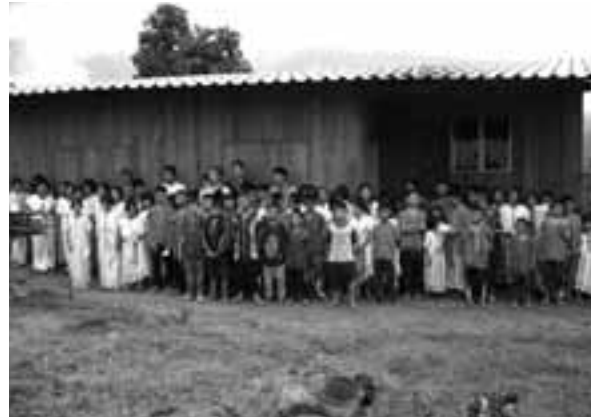
寮の献堂式 2003（平成15）年8月

このことは、毎日新聞の全国版に「寮建設で子供たちの絆」と報道された。また毎日小学生新聞に「学校に行きたい」と3回連載で記事になった。