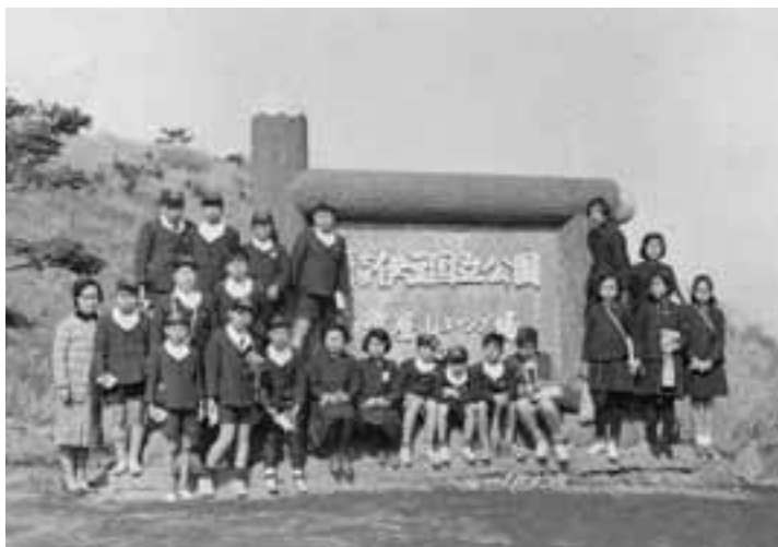
達磨山にて（修学旅行）