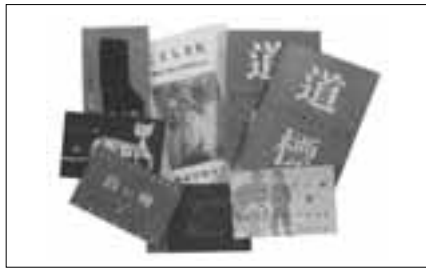
「白い柵」「道標」など文集