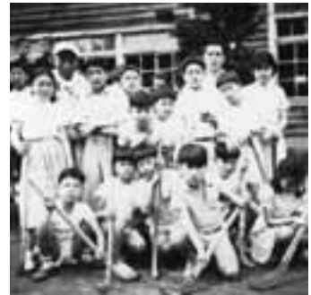
ホッケー 1952（昭和27）年9月初め

翌年の1952（昭和27）年11月には啓佑学園と改称し組織変えが行われ更に新旧の教職員の移動があった。理想的な教育は必ずしも経営的にはうまく運営出来なかったようだ。生徒数も中学部が併設されたにも関わらず、少人数化に歯止めはかからず僕の同期は遂に3名となった。名称は変わったものの学園生活は楽しく、新たに加わった中学生の兄さんや姉さん達を交え春秋の運動会、講師の先生によるホッケーやゴルフ、サッカー、クリスマスのミサやプロ演奏家によるコンサート、外国人による英語レッスン、夏のキャンプ等多彩な行事が開催された。