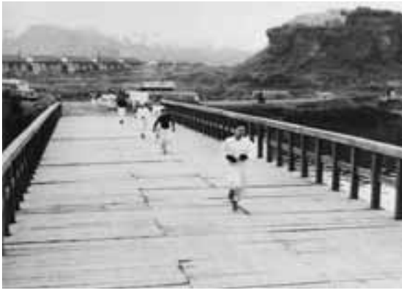
マラソン大会（昔の夕照橋） 1955（昭和30）年頃

就任した。小学校の隣に関東学院幼稚園が引っ越してきた。創立30周年記念式典が、六浦中高の礼拝堂で行われた。