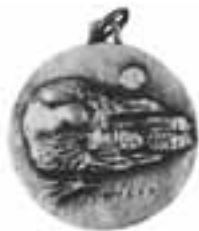
秋の屋外なかよし会 参加記念メダル

教職員全員が視点を子供の座に置いて把え、日常の様々な問題を子供の立場から研究していこうとするものでした。各クラスの問題も全教職員の問題として受けとめ、学院の特別な小学校教育を確立する場を備えたのです。その後、小学校の教育活動は全てこの場を通して練り上げられたと言えるのです。「サービス・グループ」(日直・係り)、「緑の勉強室」・「グリーン・チャンネル」(夏休みワーク帳)、「子供ライブラリー」(図書館)、「一斉テスト」(学力テスト)、「ぶどうの木子ども会」(クラブ)、「秋の屋外なかよし会」(運動会)、「緑の学校」(後の校外宿泊学校)、「夏・冬のはげみ会」(夏・冬期休暇の補習授業)等々、いずれも今日まで受け継がれている独自の教育活動です。